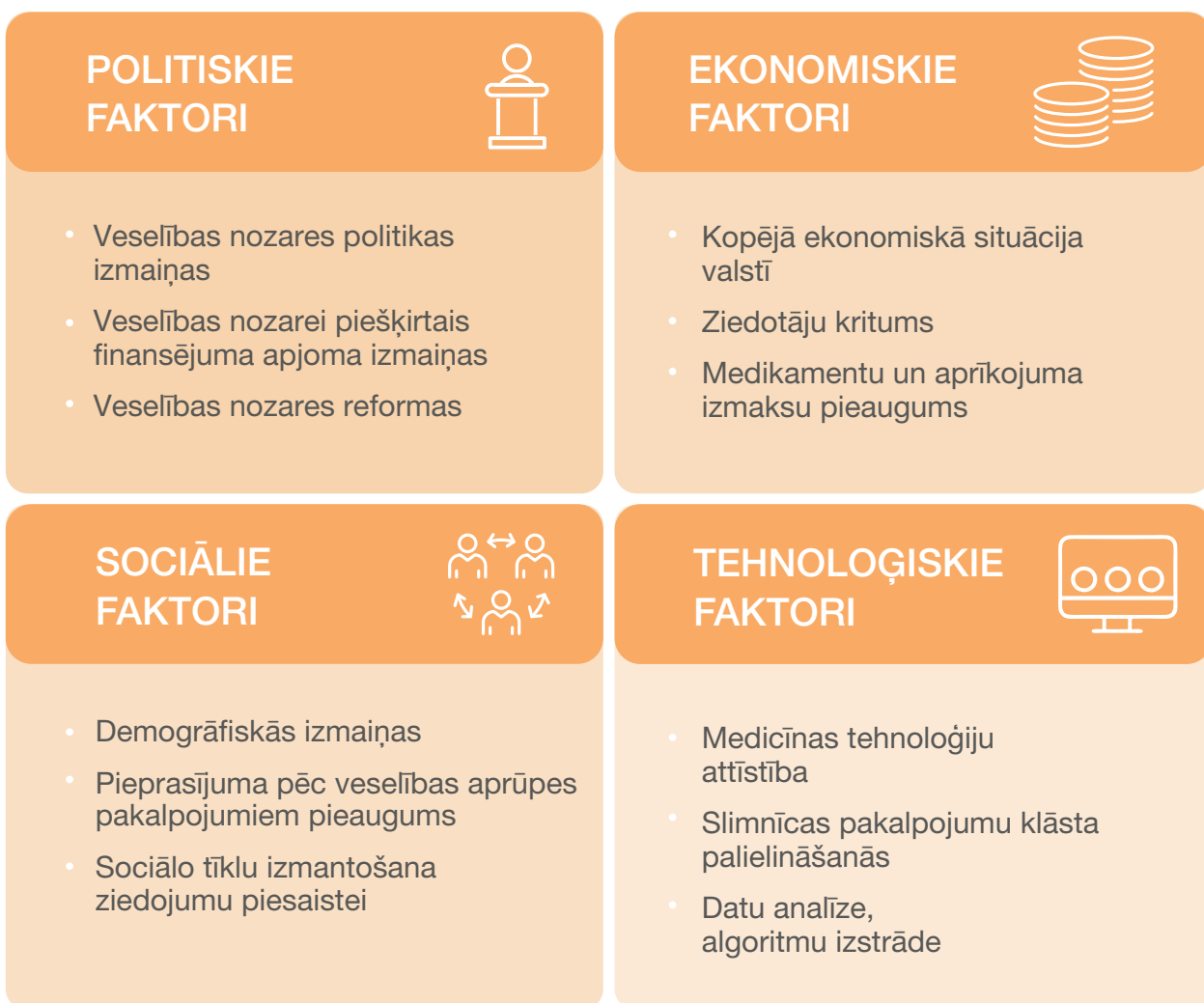
3.tabula. PEST analīze.

PEST analīzes mērķis ir identificēt ārējos vides faktorus, kas tiešā veidā var būtiski ietekmēt BSF attīstību un nākotnes darbības virzienus, veidus. Ilgtermiņa izmaiņas vides apstākļos ļauj BSF pielāgot savas darbības stratēģiju atbilstoši prognozēm.